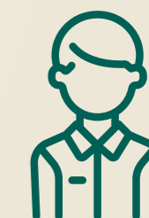
Estudiante en Prácticas

La empresa por su parte se muestra satisfecha con la realización de la práctica puntuándola con 8,78* puntos de media.