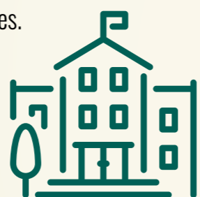
UNIVERSIDAD DE MÁLAGA